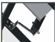
Instalace na šikmé střeše