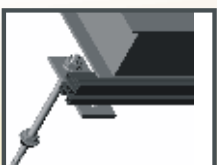
Instalace na fasády